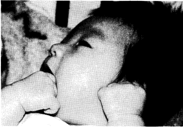
図1 生後38日の女児の指しゃぶり（空腹時のお乳が欲しいときに指しゃぶりをする）